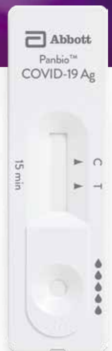
Panbio™ COVID-19 Ag Rapid Test Device