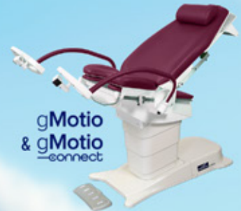
gMotio & gMotio -connect